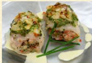
Filets de saumon farcis au crabe, amandes, sauce à la lime

2 des 6 champagnes de cette maison sont à l'occasion, disponibles au Québec. La Cuvée Sophistiquée (code #12549210) à 67,75$ et la Cuvée Vieilles Vignes mentionnée en rubrique dans le millésime 2005 (code #12549201) à 58,00$, malheureusement épuisée.