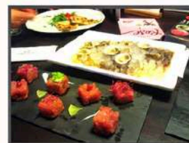
Taratufi crudi e Tartare di Tonno Rosso del Mediterraneo.

Il sito web della maison: http://www.champagne-cossy.com